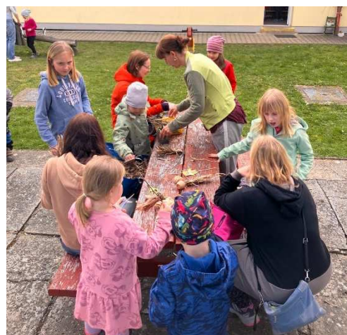
Kolektiv učitelek MŠ Lochovice

Dále jsme pro děti připravily ve třídě Slůňat