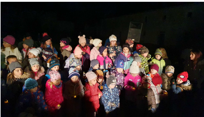
Zpívání na rozsvícení vánočního stromku